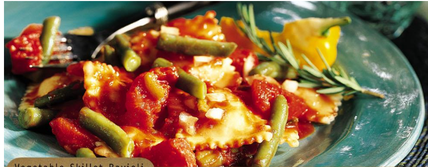
Vegetable Skillet Ravioli

DINNER JUST GOT a little easier to pull off.