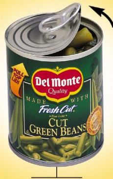
Small Serve™ PULL-TOP CAN

DINNER JUST GOT a little easier to pull off.